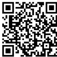
母婴保健服务人员资格认定-婚前 医学检查人员-申请